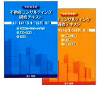
表紙はイメージです