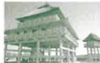
吉野ヶ里歴史公園(神埼市・吉野ヶ里町)

県東部の吉野ヶ里町、鳥栖市を訪ねます。邪馬台国の姿を彷彿とさせ話題となった吉野ヶ里遺跡は、弥生時代の日本最大級の環壕集落跡です。現在「吉野ヶ里歴史公園」として整備されています。鳥栖市にある中富記念くすり博物館は、西日本地区ではじめてのくすりの博物館です。もともと鳥栖市は、富山県と並ぶ配置売薬のさかんな所で、薬との関係は深く、製薬業は今や鳥栖の主力産業のひとつです。昼食は湖畔のレストランでステーキランチをご賞味。国内外の著名ブランド約170店舗が揃う九州最大のアウトレットセンターへもご案内します。