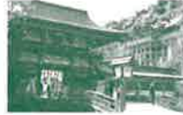
祐徳稲荷神社(鹿島市)

県南西部、有明海に面する鹿島市、太良町を訪ねます。祐徳稲荷神社(鹿島市)は日本三大稲荷に数えられる神社。木々の緑に映える建物の鮮やかな朱色が印象的で総漆塗り。石壁山を背後にして本殿がたち、山裾の広い境内には楼門、神楽殿が立っています。鹿島市は酒蔵ツーリズムを推進中、市内6酒造の一つ「幸姫酒造」で試飲とお買物をお楽しみください。ご昼食は有明海の幸「竹崎カニ」をご賞味いただきます。全国的には「ワタリガニ」として知られているものですが、太良町の竹崎地区近海で獲れるものは特に「竹崎カニ」とよばれて珍重されています。