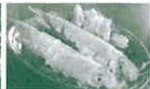
イカの活造り(唐津市呼子町)