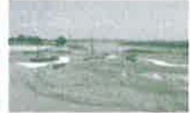
三重津海軍所跡(佐賀市)