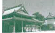
佐賀城本丸歴史館(佐賀市)

佐賀市中心部より南東部を訪ねます。「佐賀バルーンミュージアム」は、「天気は左右されず」熱気球操縦の疑似体験ができるミュージアムです。幕末維新期、日本の近代化を先導した佐賀藩。佐賀城本丸歴史館はその時代をわかりやすく伝える歴史博物館です。早稲田大学の創設者、2度にわたり総理大臣をつとめた大隈重信の記念館もご案内します。三重津海軍所跡は世界文化遺産「明治日本の産業革命遺産」の構成資産となっています。隣接する佐野常民記念館は日本赤十字社を創設した佐野常民の顕彰施設です。ご昼食は県庁12Fの展望レストランにて「佐賀牛ローストビーフ」を含む和食をご賞味ください。