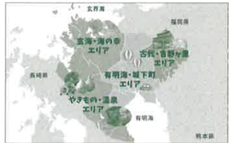
イラスト地図提供:佐賀県観光連盟