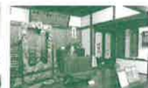
中富記念くすり博物館(鳥栖市)