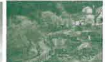
大川内山(伊万里市)