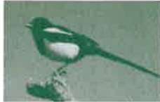
県鳥:カササギ(カチガラス)