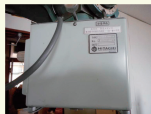
X線発生装置、溶接機、昇降機（エレベーター・エスカレーター）制御盤

高濃度PCBが使われた電気機器を見つけたら、直ちにJESCOと行政（裏面）に連絡してください。