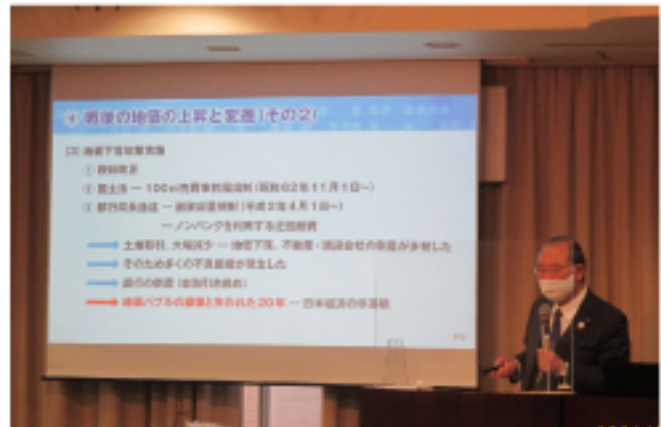
視聴画面のイメージ