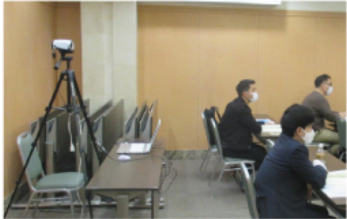
ZOOMによるオンラインライブ