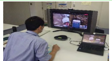
技術者が、カメラ映像を確認し、現場へ指示