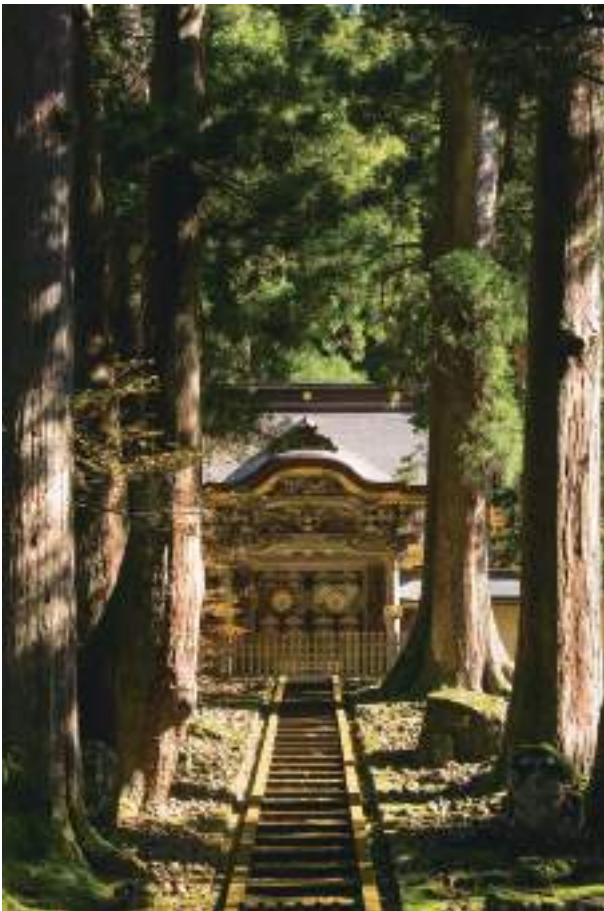
写真：「曹洞宗 大本山永平寺」