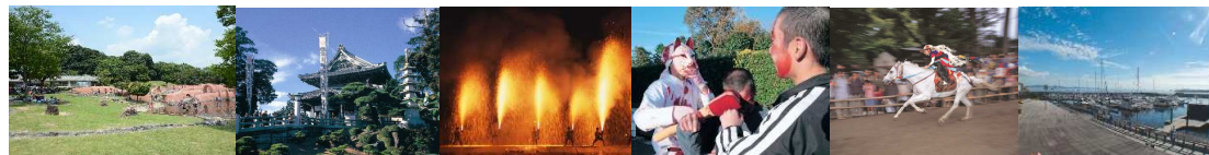
赤塚山公園 豊川稲荷(豊川開妙厳寺) 手筒花火 どんき(長松寺) 流鏝馬(砥鹿神社) 御津マリーナ