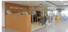
豊川市子育て支援センター（プリオ5階）