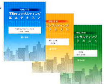
表紙はイメージです